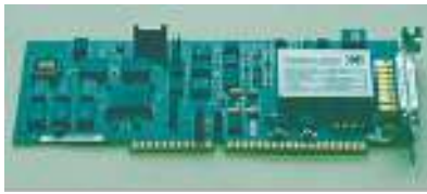
MACEAS-Ultraschall-Modul mit Digitalem Signalprozessor