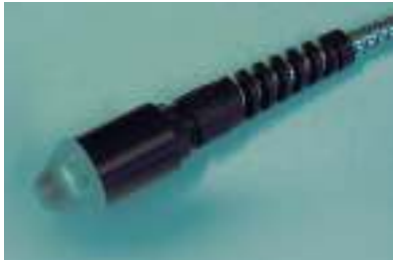
Robuster Ultraschall Prüfkopf